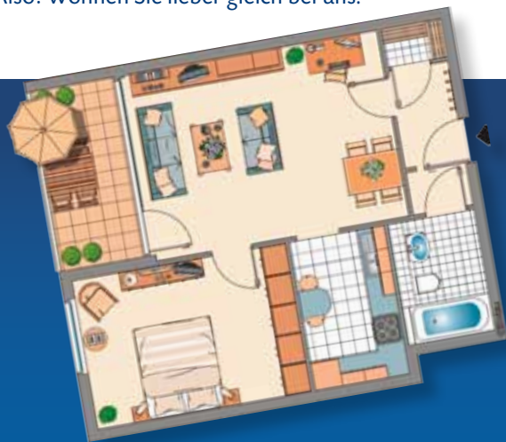
Prima und praktisch geschnitten: unsere 2-Zimmer-Wohnung