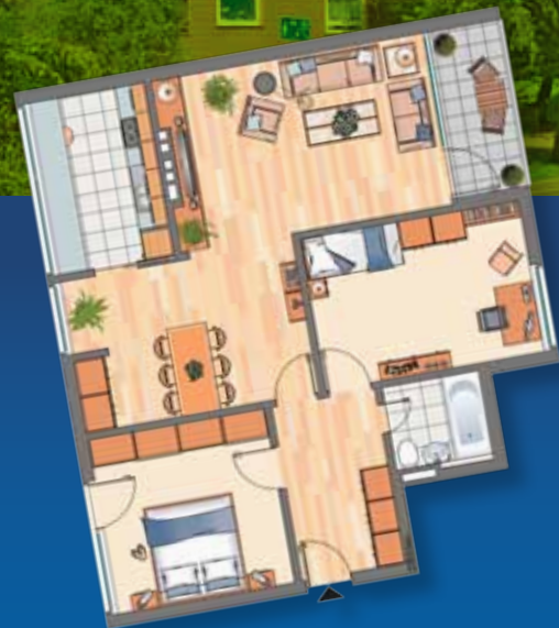
Reichlich Raum zum Wohlfühlen: unsere 3-Zimmer-Wohnung