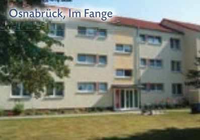
Osnabrück, Im Fange